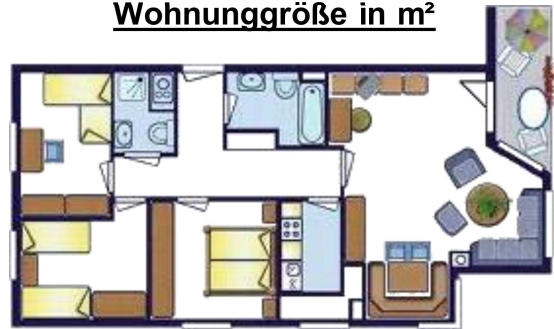
Wohnungsgröße in m 2